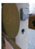
Lector de proximidad habitación.